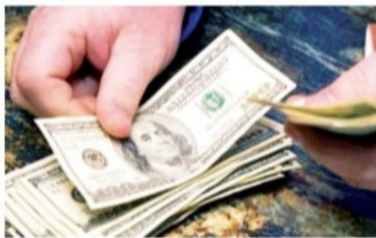
LA MONEDA estadounidense no cede y en la última jornada alcanzó un máximo de $4.396.

las monedas emergentes, sobre todo las de la región, las cuales han presentado una devaluación en los últimos días".